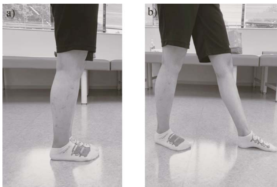
図1. ゴニオメーターでの測定における姿勢設定 a) の立位姿勢から、b) 対象下肢を1足分後方に移動させた姿勢を保持させ測定する。

2つの測定で記録されたデータは、まず各検者の平均値と標準偏差を算出した。そして、級内相関係数(Intraclass Correlation Coefficients: ICC (2,1))を算出した。次に、2つの測定での反張膝の有無を判定した。そのため、文献 3) を基に10度以上のものを反張膝と定義し、それぞれの測定で記録された角度からその判定を行った。そして、各検者で反張膝と判定された肢の数と割